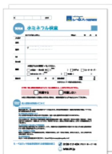
① 質問票 採水方法