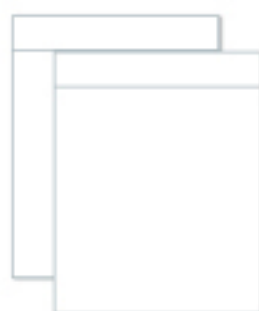
③ ジッパー袋 2枚